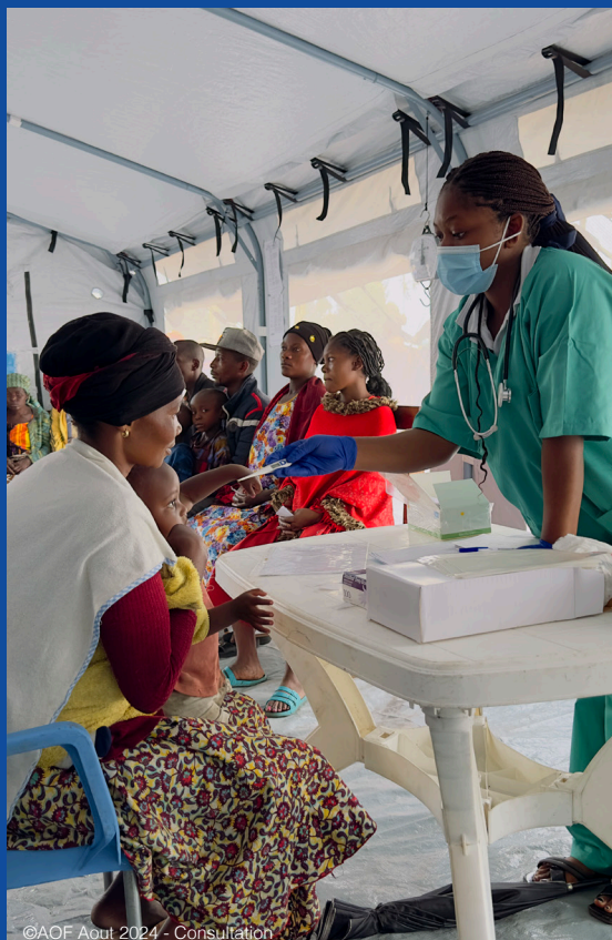
Consultation