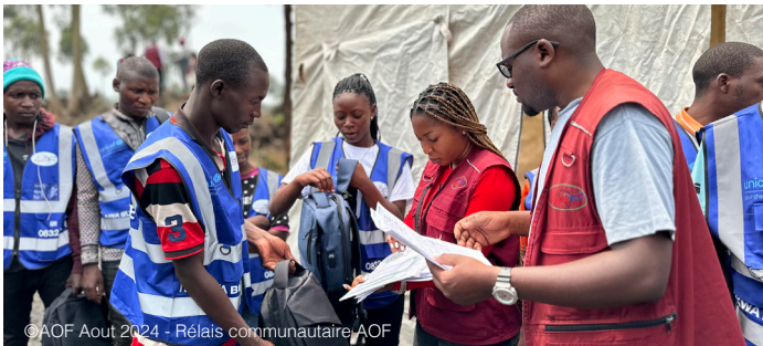
Aout 2024 - Relais communautaire AOF

Une attention particulière a été portée à l'épidémie de MPOX avec 136 cas suspects diagnostiqués et référés vers les centres de prise en charge. 16 cas suspects de rougeole ont également été diagnostiqués et ont bénéficiés d'un traitement symptomatique adéquat.