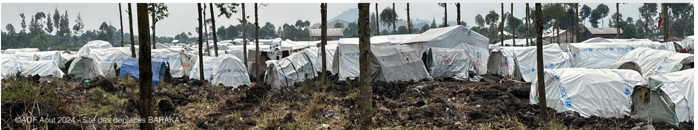
Aout 2024 - Site des déplacés BARAKA

3,262 adolescents et jeunes dont 1993 filles et 1269 garçons ont été sensibilisés sur la santé sexuelle et reproductive.