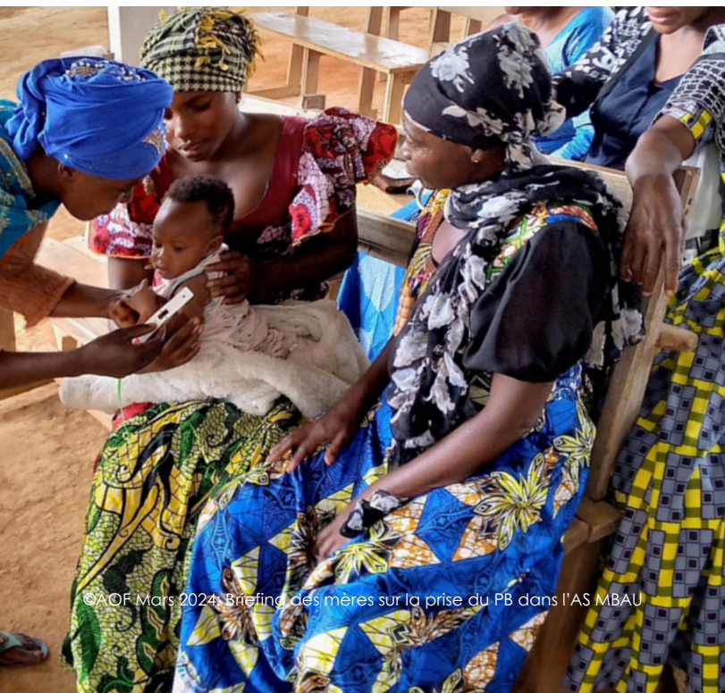
©AOF Mars 2024: Briefing des mères sur la prise du PB dans l'AS MBAU