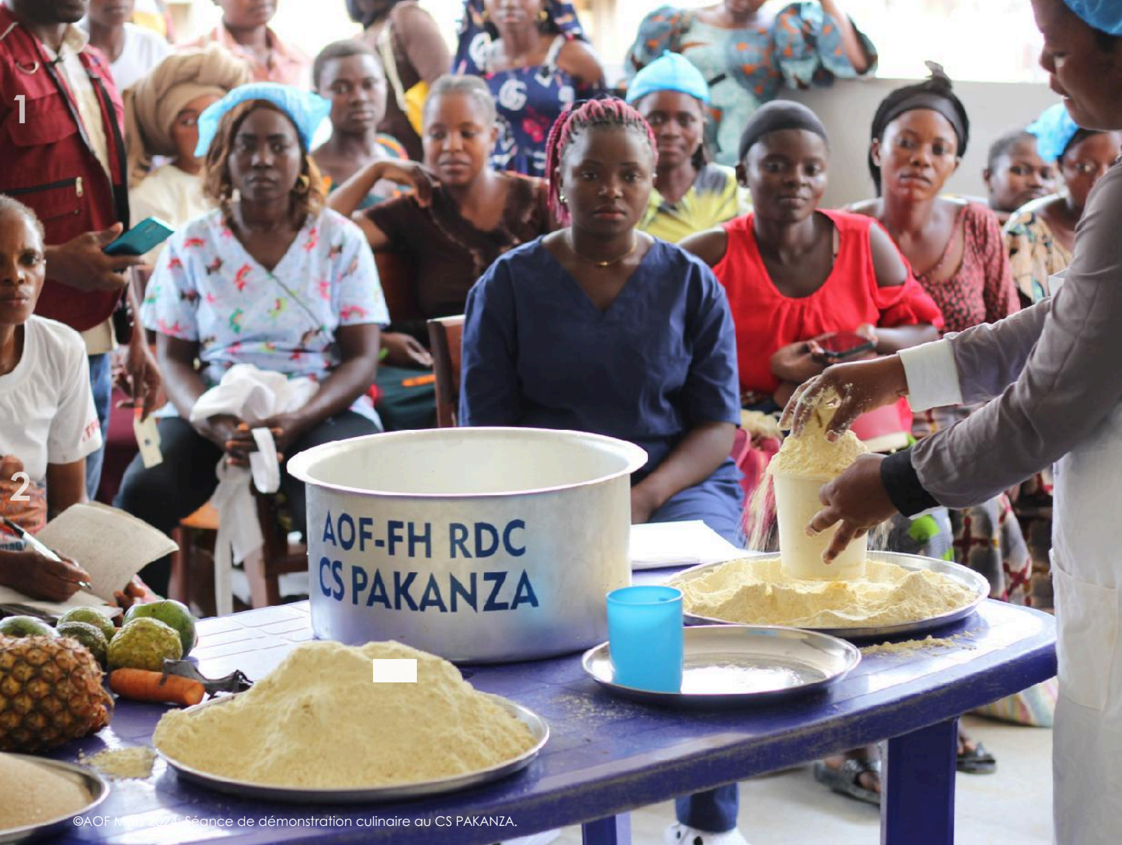
Séance de démonstration culinaire au CS PAKANZA.