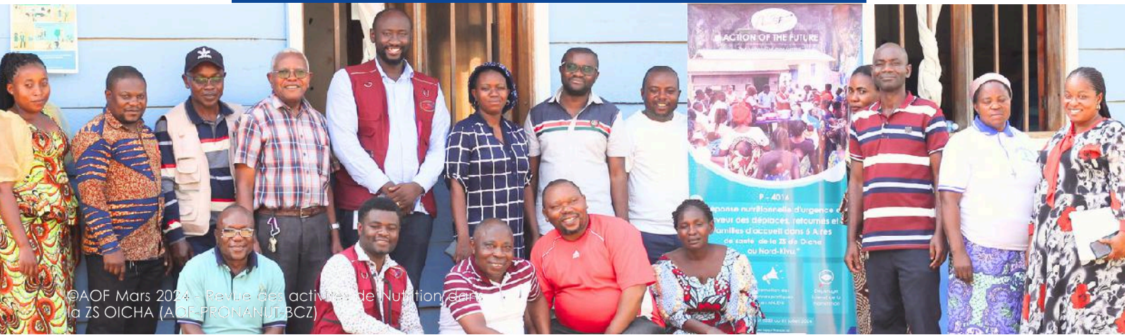
©AOF Mars 2024 - Revue des activités de Nutrition dans la ZS OICHA (AOF-PRONANUT-BCZ)